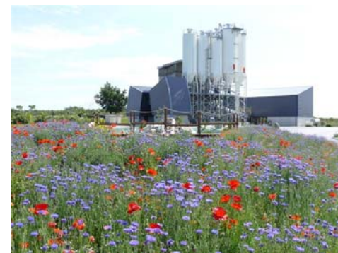
CTSDU de Graulhet

Les questions relatives au stockage et au traitement des déchets sont au cœur de nombreuses controverses. L'implantation d'un nouveau centre de traitement et de stockage de déchets Ultimes (CTSDU) pose un problème d'acceptabilité sociale. La mise en place d'une procédure transparente et la participation active des citoyens dans le processus de décision sont devenues des étapes incontournables.