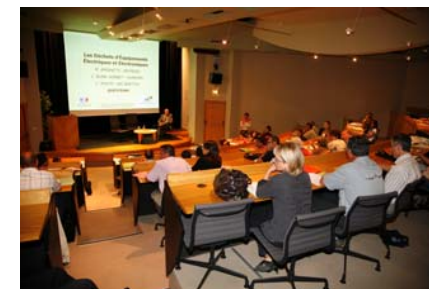
Journée d'information DEEE médicaux, Labège, octobre 2007

■ L'Observatoire organise régulièrement dans le cadre de ses missions d'information et de concertation des journées thématiques , par exemple sur les films plastiques agricoles usagés, ou encore les déchets des équipements électriques et électroniques.